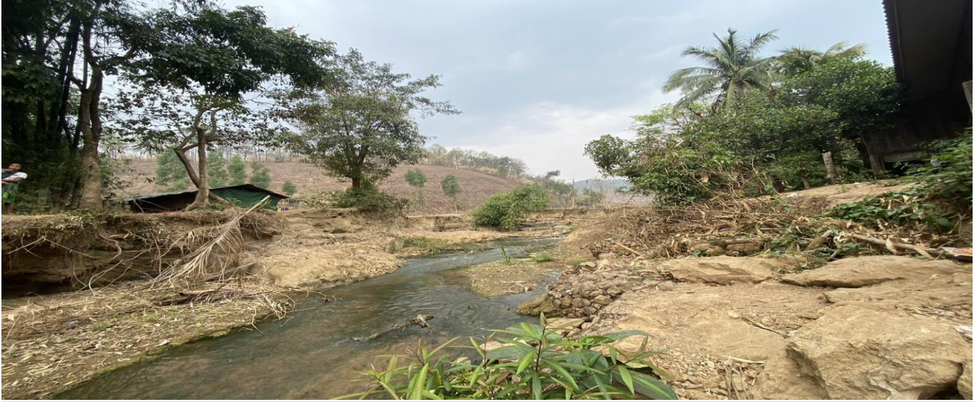
รูปตัดขวางลำน้ำ ปีนี้ 2567 สถานี Sw.16 ห้วยแม่สอด อ.แม่สอด จ.ตาก